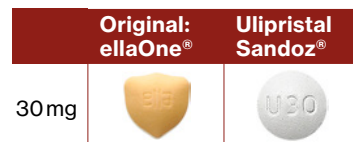
Abbildungen entsprechen der Originalgrösse.